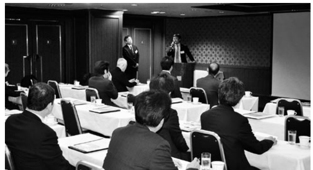
九州支部研修会風景

NPO法人 日本パーキングビジネス協会では、駐車場のオーナー・ユーザー両方の様々なニーズにマッチした駐車場づくりを目指しております。